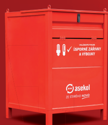
kovová nádoba* 80 × 80 × 115 cm