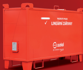
kovová nádoba* 160 × 50 × 80 cm